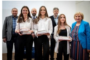
Finał konkursu „Kresy – polskie ziemie wschodnie w XX wieku” na etapie wojewódzkim.