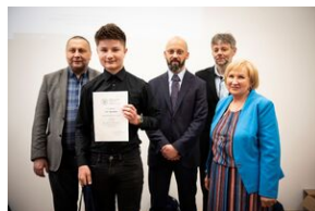
Finał konkursu „Kresy – polskie ziemie wschodnie w XX wieku” na etapie wojewódzkim.