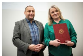
Finał konkursu „Kresy – polskie ziemie wschodnie w XX wieku” na etapie wojewódzkim.