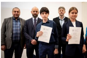
Finał konkursu „Kresy – polskie ziemie wschodnie w XX wieku” na etapie wojewódzkim.