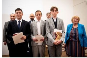
Finał konkursu „Kresy – polskie ziemie wschodnie w XX wieku” na etapie wojewódzkim.