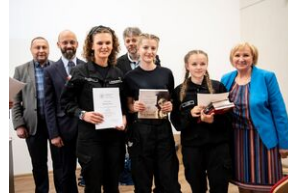
Finał konkursu „Kresy – polskie ziemie wschodnie w XX wieku” na etapie wojewódzkim.