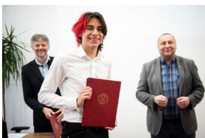
Finał konkursu „Kresy – polskie ziemie wschodnie w XX wieku” na etapie wojewódzkim.