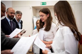
Finał konkursu „Kresy – polskie ziemie wschodnie w XX wieku” na etapie wojewódzkim.