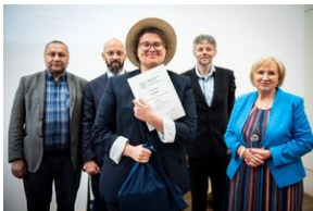
Finał konkursu „Kresy – polskie ziemie wschodnie w XX wieku” na etapie wojewódzkim.