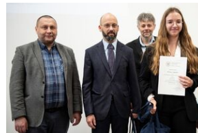
Finał konkursu „Kresy – polskie ziemie wschodnie w XX wieku” na etapie wojewódzkim.