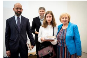
Finał konkursu „Kresy – polskie ziemie wschodnie w XX wieku” na etapie wojewódzkim.