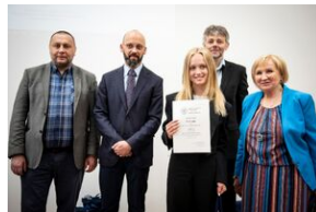
Finał konkursu „Kresy – polskie ziemie wschodnie w XX wieku” na etapie wojewódzkim.