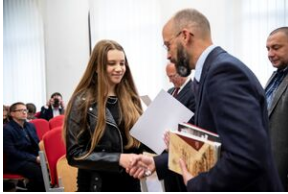
Finał konkursu „Kresy – polskie ziemie wschodnie w XX wieku” na etapie wojewódzkim.