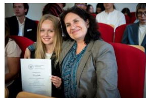
Finał konkursu „Kresy – polskie ziemie wschodnie w XX wieku” na etapie wojewódzkim.