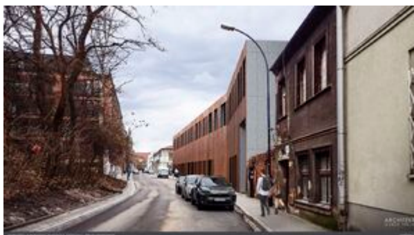
Wizualizacja nowej siedziby Oddziału IPN w Krakowie