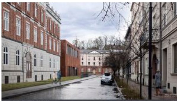
Wizualizacja nowej siedziby Oddziału IPN w Krakowie