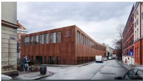
Wizualizacja nowej siedziby Oddziału IPN w Krakowie

Od ponad 20 lat kierownictwo Oddziału IPN w Krakowie dąży do połączenia całej instytucji w jednej lokalizacji. Jest to uzasadnione merytorycznie, funkcjonalnie i finansowo. Obniży wydatki związane z działalnością oddziału, generowane dotąd przez konieczność wynajmowania lokali na zasadach komercyjnych oraz koszty transportu i bieżącej komunikacji między Krakowem i Wieliczką. Ułatwi także wszystkim zainteresowanym kontakt z naszą instytucją, zwłaszcza osobom korzystającym