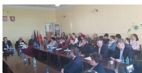
5 lutego 2020. Wystawa „Ukradzione dzieciństwo” w Kozłowie