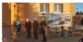
5 lutego 2020. Wystawa „Ukradzione dzieciństwo” w Kozłowie