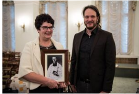
Wręczenie not identyfikacyjnych rodzinom ofiar komunizmu – Warszawa, 3 grudnia 2019.