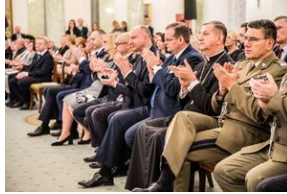
Wręczenie not identyfikacyjnych rodzinom ofiar komunizmu – Warszawa, 3 grudnia 2019.