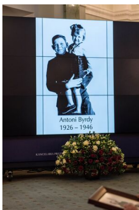
Wręczenie not identyfikacyjnych rodzinom ofiar komunizmu - Warszawa, 3 grudnia 2019.