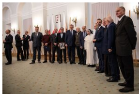
Wręczenie not identyfikacyjnych rodzinom ofiar komunizmu – Warszawa, 3 grudnia 2019.