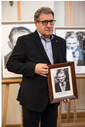
Wręczenie not identyfikacyjnych rodzinom ofiar komunizmu – Warszawa, 3 grudnia 2019.