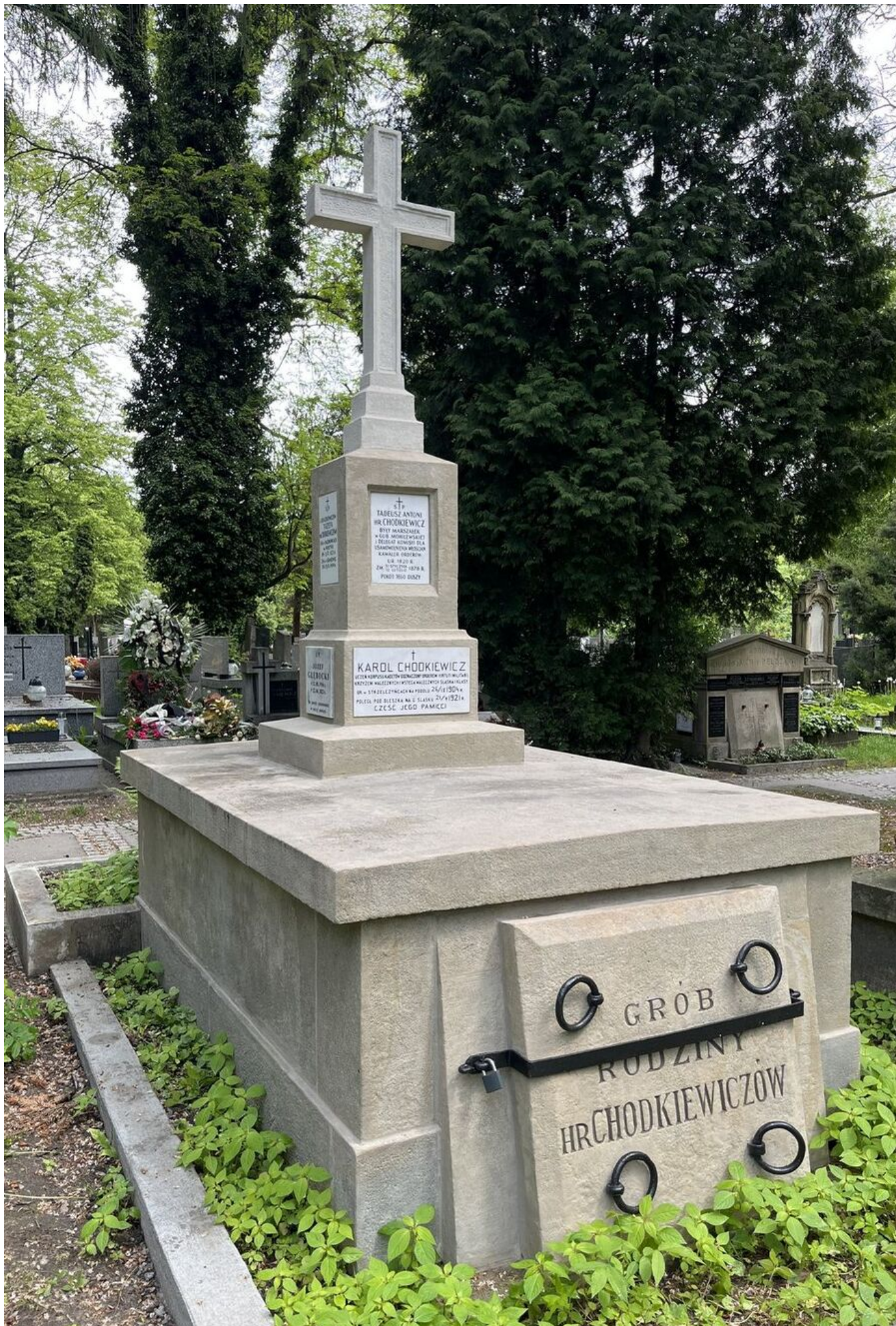
Odnowiony przez IPN grób Karola Chodkiewicza.