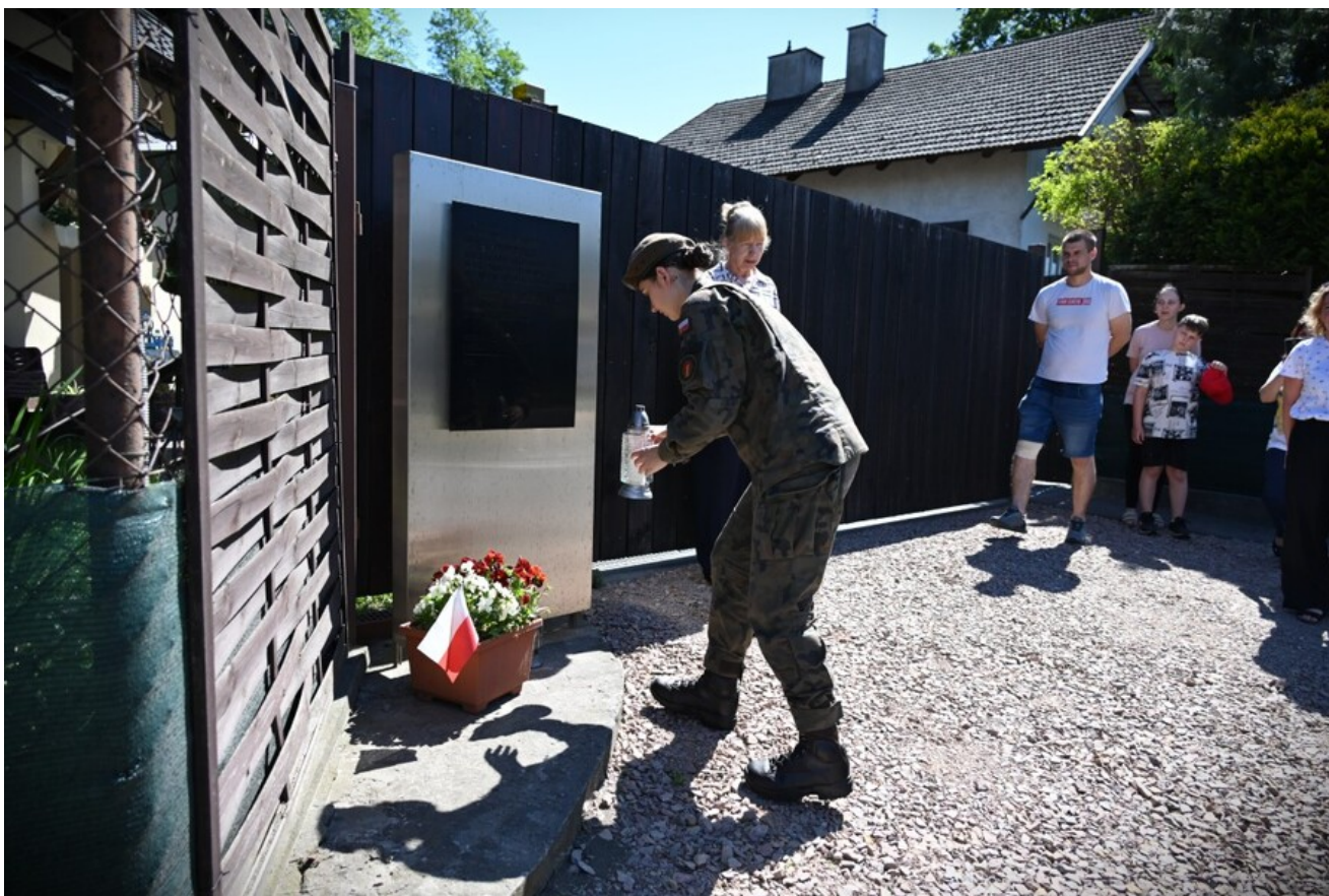
Znicze pamięci w 78. rocznicę śmierci rtm. Witolda Pileckiego.

Następnie dyrektor Radoń złożyła znicz pod tablicą przy dworku Koryznówka w Nowym Wiśniczu (obecnie remontowanym Muzeum Pamiątek po Janie Matejce), gdzie nadal można zobaczyć stodołę, w której Witold Pilecki sypiał, ukrywając się na terenie dworku przez kilka tygodni.