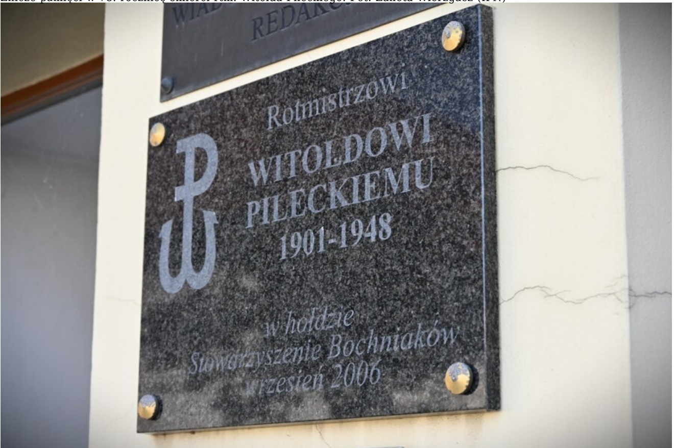
Znicze pamięci w 78. rocznicę śmierci rtm. Witolda Pileckiego.