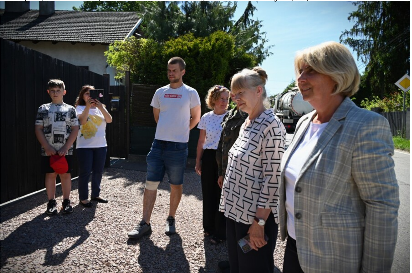
Znicze pamięci w 78. rocznicę śmierci rtm. Witolda Pileckiego.