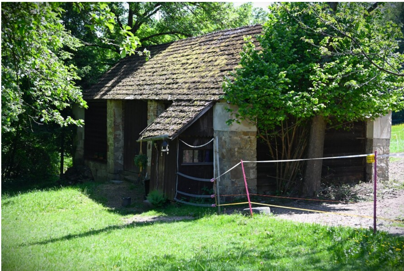
Znicze pamięci w 78. rocznicę śmierci rtm. Witolda Pileckiego.