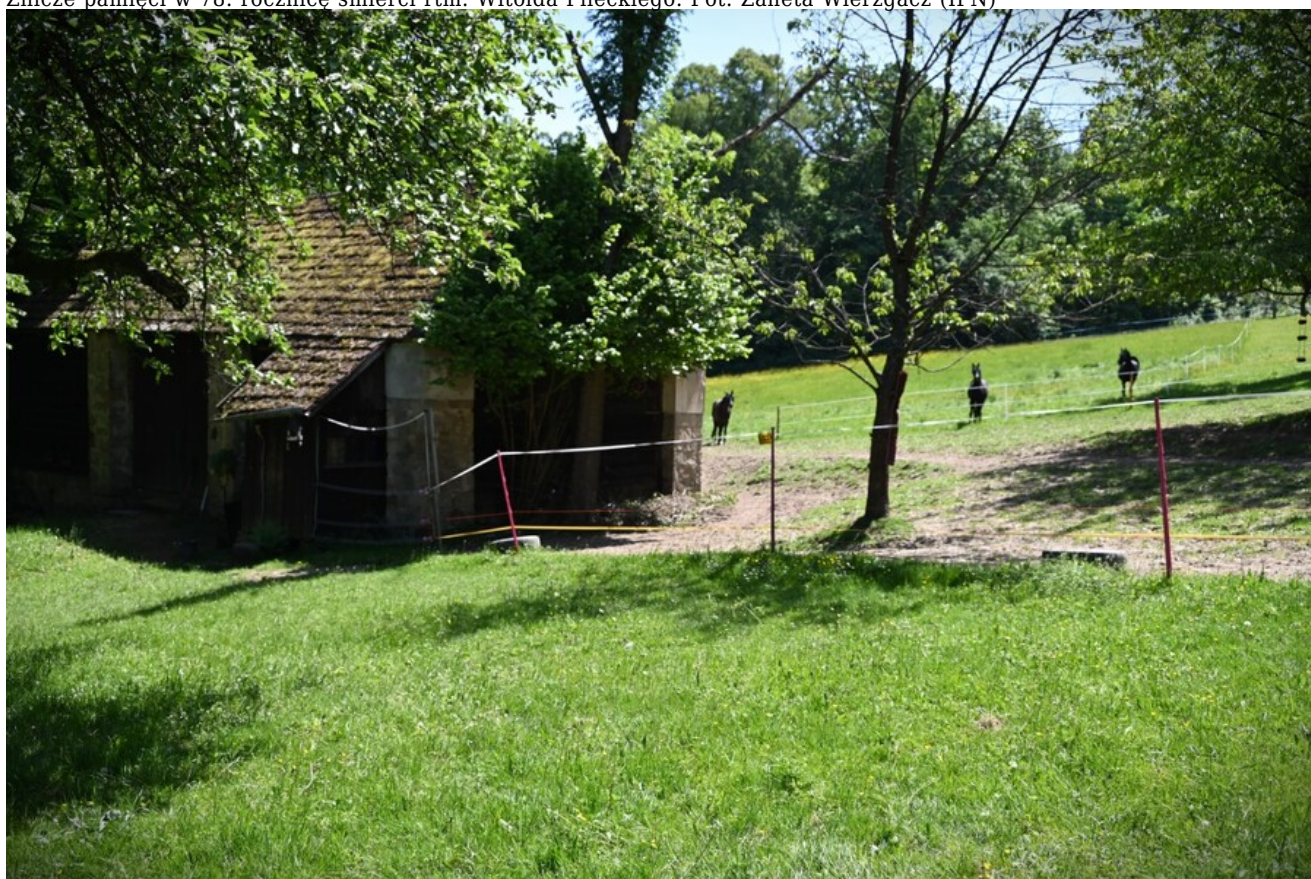
Znicze pamięci w 78. rocznicę śmierci rtm. Witolda Pileckiego.