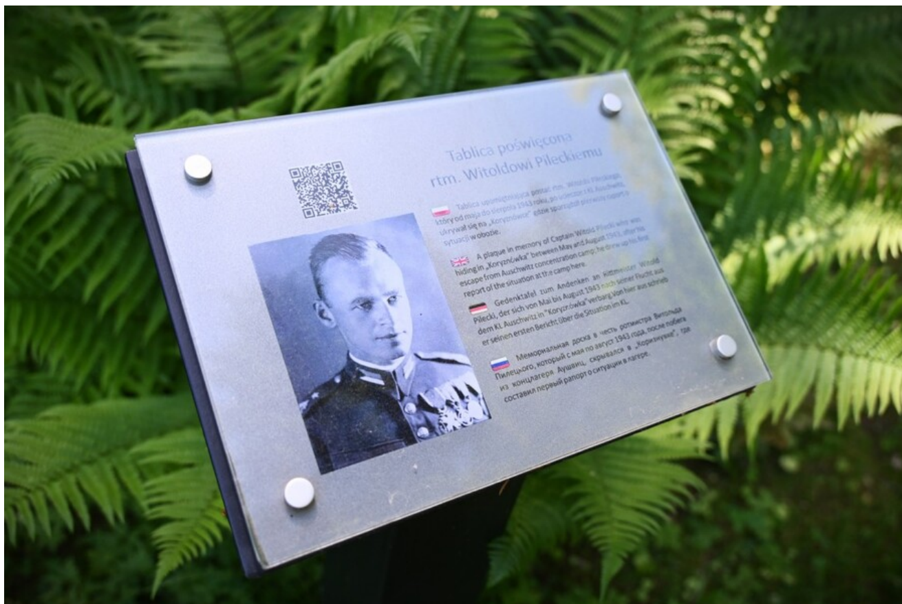
Znicze pamięci w 78. rocznicę śmierci rtm. Witolda Pileckiego.