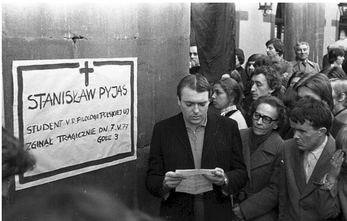
Studencka solidarność odpowiedzią na zamordowanie Stanisława Pyjasa