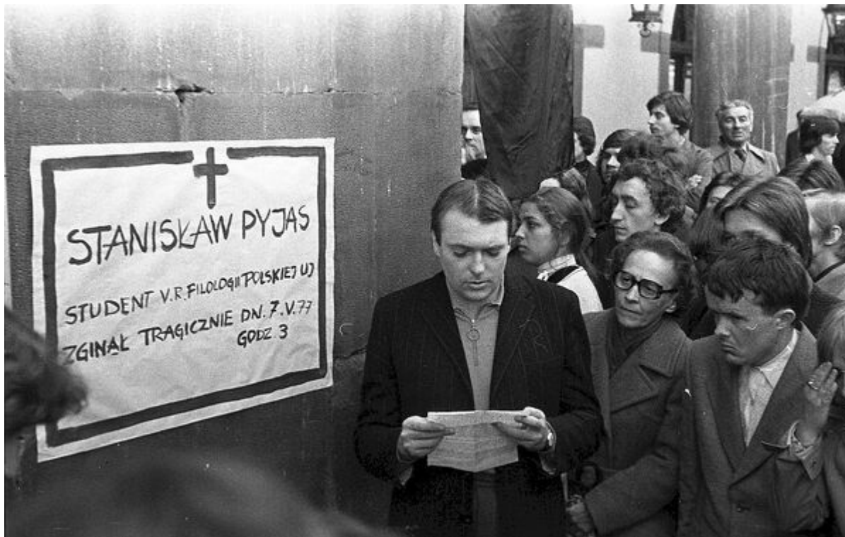
Studencka solidarność odpowiedzią na zamordowanie Stanisława Pyjasa