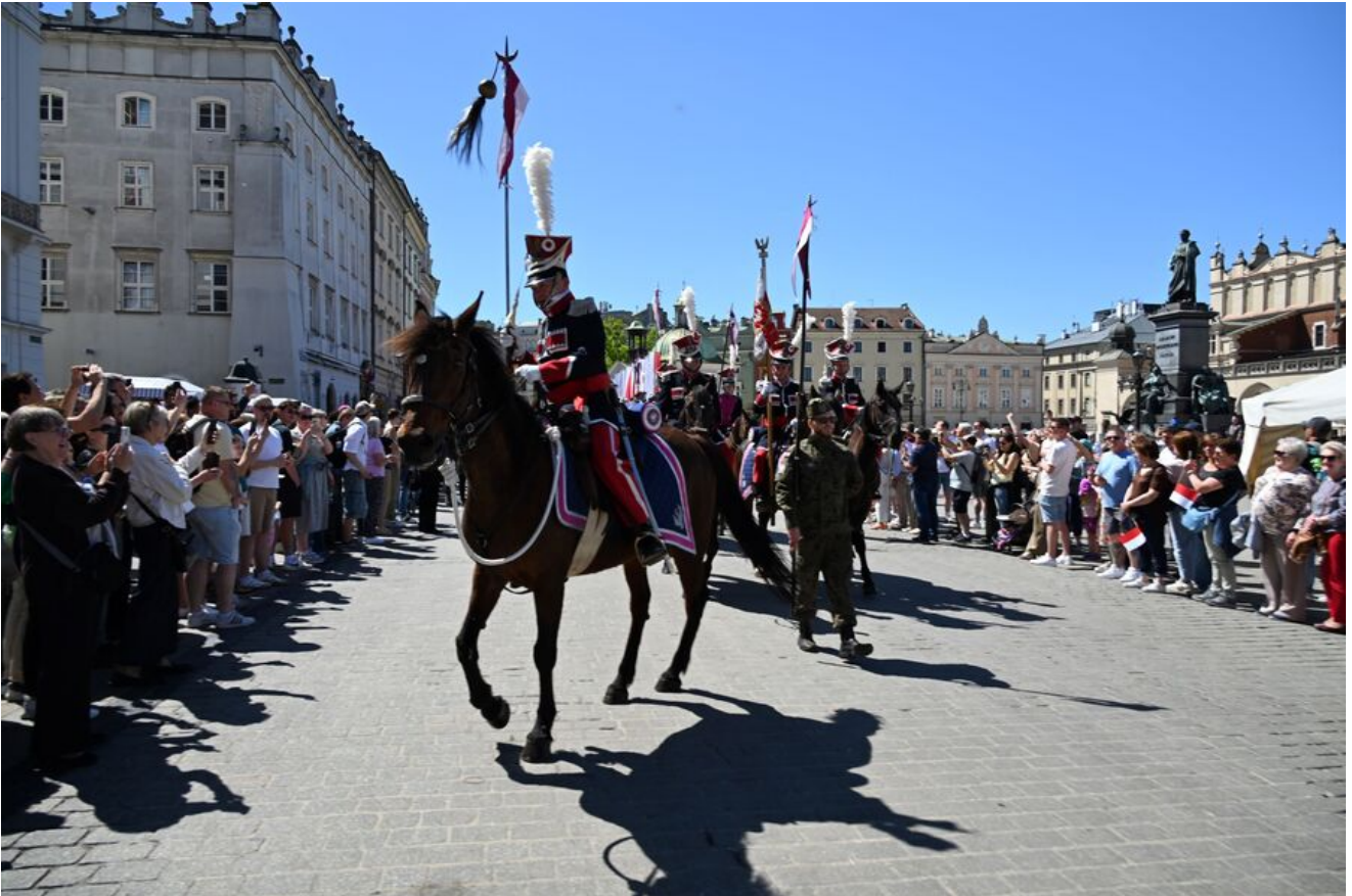
Uroczystości z okazji Święta Narodowego Trzeciego Maja.