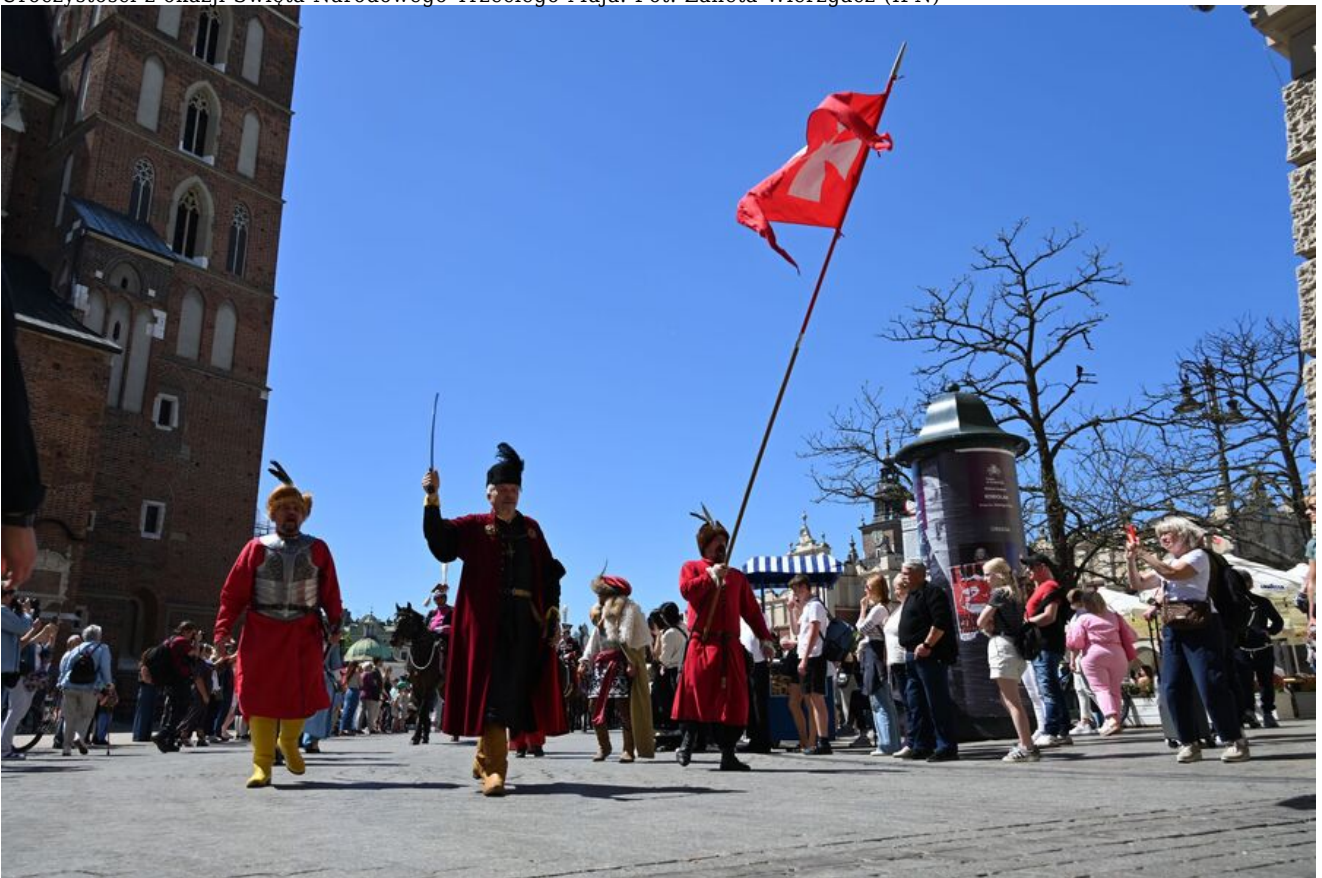
Uroczystości z okazji Święta Narodowego Trzeciego Maja.