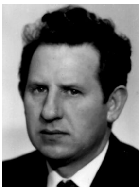
Edmund Rogalski.