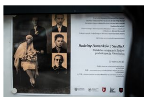
Uroczystości w Miechowie i Siedliskach.