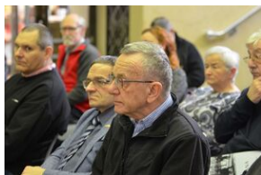
Archiwalna środa na „Przystanku Historia” w Krakowie.