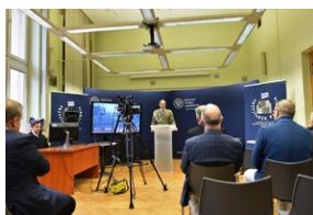
Promocja płyty „Nieziomni”.