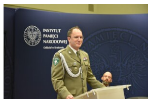
Promocja płyty „Nieziomni”.