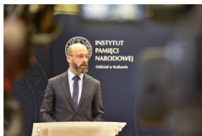
Promocja płyty „Nieziomni”.