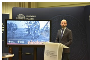
Promocja płyty „Nieziomni”.