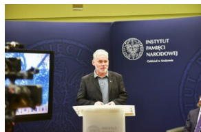
Promocja płyty „Nieziomni”.

11. Tango na głos, orkiestrę i jeszcze jeden głos – muz. Grzegorz Tomczak, śl. Grzegorz Tomczak, arr. Mirosław Racewicz – Irena Michalska – Soul Sanok