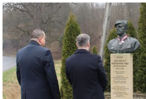
Osielec. Pomnik Zygmunta Szendzielarza „Łupaszki”.