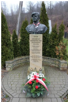
Osielec. Pomnik Zygmunta Szendzielarza „Łupaszki”.