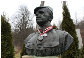
Osielec. Pomnik Zygmunta Szendzielarza „Łupaszki”.