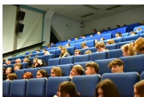
„Żołnierze Niepodległości. Walka o wolną Polskę 1944-1963”. Seanse filmowe dla krakowskiej młodzieży.