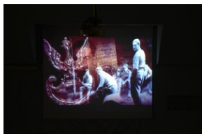
„Żołnierze Niepodległości. Walka o wolną Polskę 1944-1963”. Seanse filmowe dla krakowskiej młodzieży.