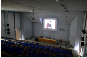
„Żołnierze Niepodległości. Walka o wolną Polskę 1944-1963”. Seanse filmowe dla krakowskiej młodzieży.