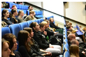
„Żołnierze Niepodległości. Walka o wolną Polskę 1944-1963”. Seanse filmowe dla krakowskiej młodzieży.