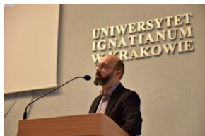
„Żołnierze Niepodległości. Walka o wolną Polskę 1944-1963”. Seanse filmowe dla krakowskiej młodzieży.

W lekcji historii wzięła udział liczna grupa krakowskich uczniów.