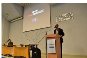
„Żołnierze Niepodległości. Walka o wolną Polskę 1944-1963”. Seanse filmowe dla krakowskiej młodzieży.