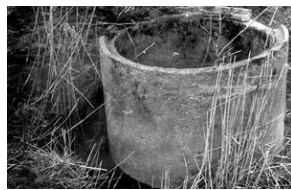
Studzienka, w której znaleziono zwłoki