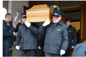
Uroczystości pogrzebowe ks. Tadeusza Isakowicza-Zaleskiego.