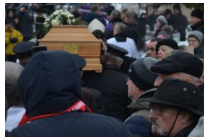
Uroczystości pogrzebowe ks. Tadeusza Isakowicza-Zaleskiego.