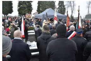
Uroczystości pogrzebowe ks. Tadeusza Isakowicza-Zaleskiego.