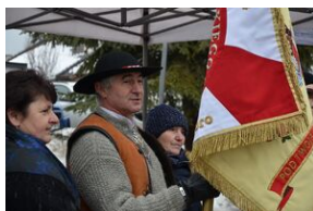
Uroczystości pogrzebowe ks. Tadeusza Isakowicza-Zaleskiego.