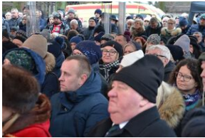
Uroczystości pogrzebowe ks. Tadeusza Isakowicza-Zaleskiego.