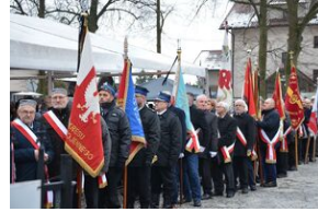
Uroczystości pogrzebowe ks. Tadeusza Isakowicza-Zaleskiego.