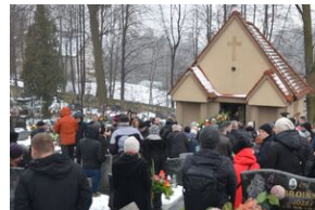
Uroczystości pogrzebowe ks. Tadeusza Isakowicza-Zaleskiego.