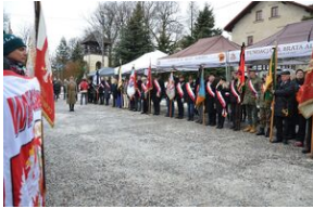
Uroczystości pogrzebowe ks. Tadeusza Isakowicza-Zaleskiego.