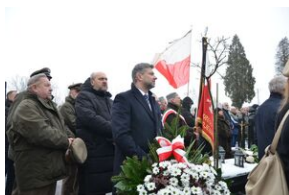
Uroczystości pogrzebowe ks. Tadeusza Isakowicza-Zaleskiego.