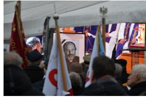
Uroczystości pogrzebowe ks. Tadeusza Isakowicza-Zaleskiego.