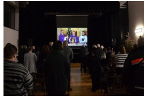
Uroczystości pogrzebowe ks. Tadeusza Isakowicza-Zaleskiego.