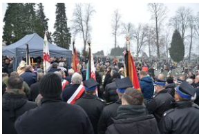
Uroczystości pogrzebowe ks. Tadeusza Isakowicza-Zaleskiego.