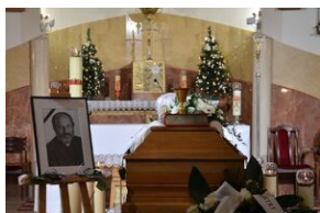
Uroczystości pogrzebowe ks. Tadeusza Isakowicza-Zaleskiego.