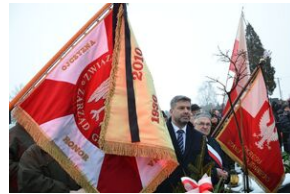
Uroczystości pogrzebowe ks. Tadeusza Isakowicza-Zaleskiego.