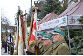
Uroczystości pogrzebowe ks. Tadeusza Isakowicza-Zaleskiego.