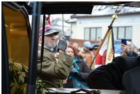
Uroczystości pogrzebowe ks. Tadeusza Isakowicza-Zaleskiego.