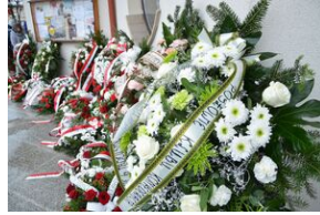
Uroczystości pogrzebowe ks. Tadeusza Isakowicza-Zaleskiego.