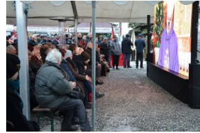
Uroczystości pogrzebowe ks. Tadeusza Isakowicza-Zaleskiego.