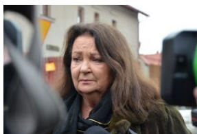
Uroczystości pogrzebowe ks. Tadeusza Isakowicza-Zaleskiego.