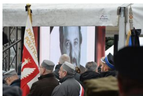
Uroczystości pogrzebowe ks. Tadeusza Isakowicza-Zaleskiego.

Ks. Isakowicz-Zaleski był działaczem opozycji antykomunistycznej, kapłanem podziemnej „Solidarności”, opiekunem niepełnosprawnych i prezesem Fundacji im. Brata Alberta, historykiem Kościoła, zwolennikiem lustracji duchownych, publicystą, rzecznikiem upamiętnienia ofiar i potępienia sprawców ludobójstwa dokonanego na Kresach Wschodnich przez ukraińskich nacjonalistów.