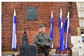
Uroczystość z okazji 105. rocznicy wyzwolenia Krakowa z rąk austriackich.