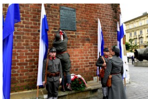
Uroczystość z okazji 105. rocznicy wyzwolenia Krakowa z rąk austriackich.