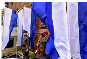
Uroczystość z okazji 105. rocznicy wyzwolenia Krakowa z rąk austriackich.