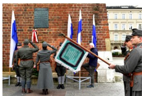
Uroczystość z okazji 105. rocznicy wyzwolenia Krakowa z rąk austriackich.