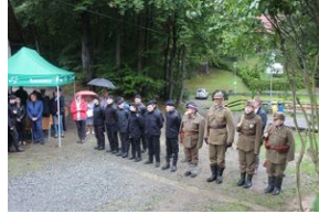
W bazie Lubogoszcz odsłonięto tablicę żołnierzy AK z oddziału „Mszyca”.