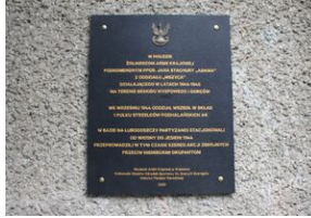
W bazie Lubogoszcz odsłonięto tablicę żołnierzy AK z oddziału „Mszyca”.