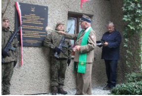
W bazie Lubogoszcz odsłonięto tablicę żołnierzy AK z oddziału „Mszyca”.