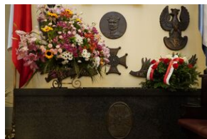
63. rocznica śmierci gen. Józefa Hallera.