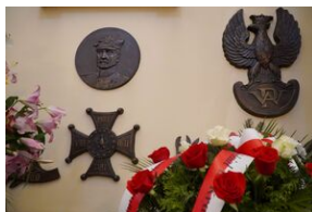
63. rocznica śmierci gen. Józefa Hallera.