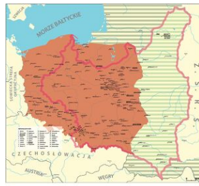
Obozy i więzienia sowieckie na ziemiach polskich w latach 1944-1945 ■ Polska w okupacji polskiej ■ Polska w okupacji niemieckiej ■ Obozy i więzienia sowieckie w Polsce ■ Obozy i więzienia sowieckie w Polsce (1944-1945) ■ Obozy i więzienia sowieckie w Polsce (1944-1945) ■ Obozy i więzienia sowieckie w Polsce (1944-1945) ■ Obozy i więzienia sowieckie w Polsce (1944-1945) ■ Obozy i więzienia sowieckie w Polsce (1944-1945)