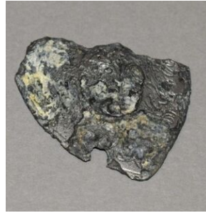
Fragmety ryngrafu odnalezionego przy szczątkach Józefa Orkisz „Lotnego”