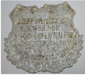
Tabliczka z grobu Józefa Orkisz, odnaleziona podczas prac poszukiwawczych, po konserwacji