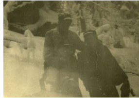
„Wiarusy” w zimowej scenerii, po utracie tzw. bunkra nad Harklową