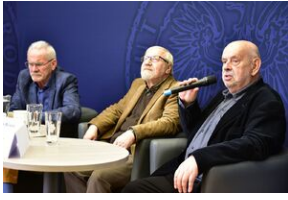
Panel dyskusyjny na „Przystanku Historia” IPN.