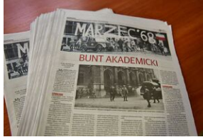
Panel dyskusyjny na „Przystanku Historia” IPN.