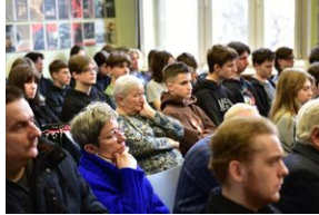
Panel dyskusyjny na „Przystanku Historia” IPN.