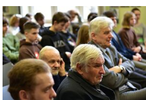
Panel dyskusyjny na „Przystanku Historia” IPN.