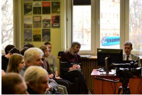
Panel dyskusyjny na „Przystanku Historia” IPN.