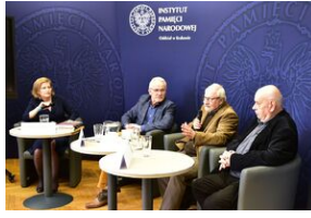
Panel dyskusyjny na „Przystanku Historia” IPN.