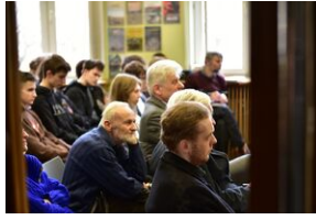
Panel dyskusyjny na „Przystanku Historia” IPN.