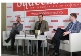
Wydawnictwo IPN na 5. Sąddeckich Targach Książki w Krynicy.