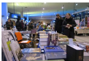
Wydawnictwo IPN na 5. Sąddeckich Targach Książki w Krynicy.