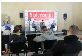
Wydawnictwo IPN na 5. Sąddeckich Targach Książki w Krynicy.