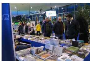
Wydawnictwo IPN na 5. Sąddeckich Targach Książki w Krynicy.