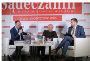
Wydawnictwo IPN na 5. Sąddeckich Targach Książki w Krynicy.