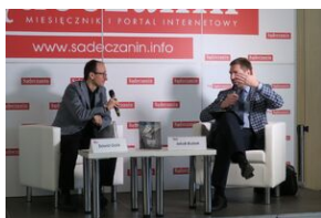
Wydawnictwo IPN na 5. Sąddeckich Targach Książki w Krynicy.