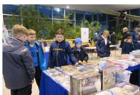
Wydawnictwo IPN na 5. Sąddeckich Targach Książki w Krynicy.