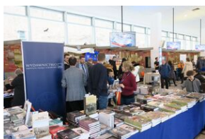
Wydawnictwo IPN na 5. Sąddeckich Targach Książki w Krynicy.