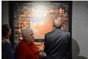
Wystawa o zesłańcach na Syberię w Forcie Skotniki.