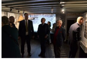
Wystawa o zesłańcach na Syberię w Forcie Skotniki.