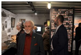
Wystawa o zesłańcach na Syberię w Forcie Skotniki.