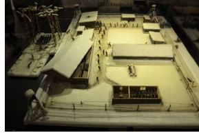
Wystawa o zesłańcach na Syberię w Forcie Skotniki.