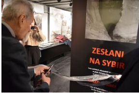
Wystawa o zesłańcach na Syberię w Forcie Skotniki.