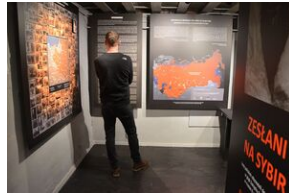
Wystawa o zesłańcach na Syberię w Forcie Skotniki.