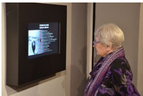
Wystawa o zesłańcach na Syberię w Forcie Skotniki.