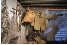
Wystawa o zesłańcach na Syberię w Forcie Skotniki.