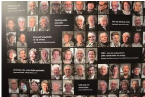
Wystawa o zesłańcach na Syberię w Forcie Skotniki.