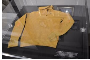
Wystawa o zesłańcach na Syberię w Forcie Skotniki. Żółty sweterek Krystyny Serafin.