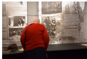
Wystawa o zesłańcach na Syberię w Forcie Skotniki.