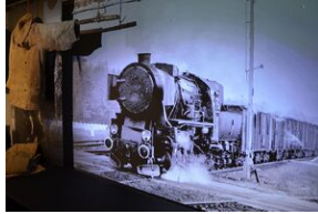
Wystawa o zesłańcach na Syberię w Forcie Skotniki.