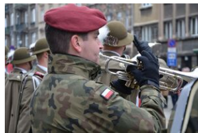
81. rocznica przekształcenia ZWZ w Armię Krajową. Fot.