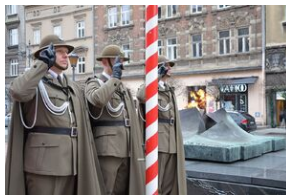
81. rocznica przekształcenia ZWZ w Armię Krajową. Fot.