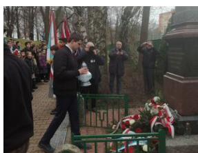
W Krakowie uczczono pamięć ofiar niemieckiej pacyfikacji na Dąbiu.