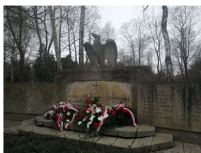
W Krakowie uczczono pamięć ofiar niemieckiej pacyfikacji na Dąbiu.