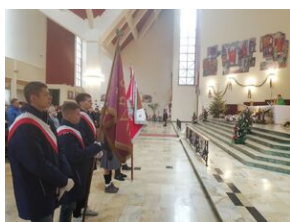
W Krakowie uczczono pamięć ofiar niemieckiej pacyfikacji na Dąbiu.