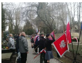
W Krakowie uczczono pamięć ofiar niemieckiej pacyfikacji na Dąbiu.