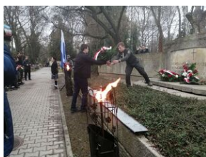
W Krakowie uczczono pamięć ofiar niemieckiej pacyfikacji na Dąbiu.