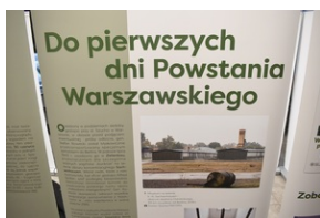
Wystawa o Stefanie Roweckim „Grocie”.