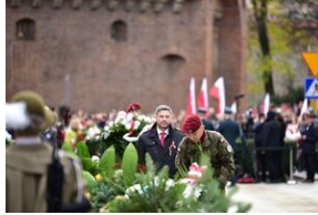
Narodowe Święto Niepodległości.