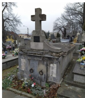
Grób przed remontem.