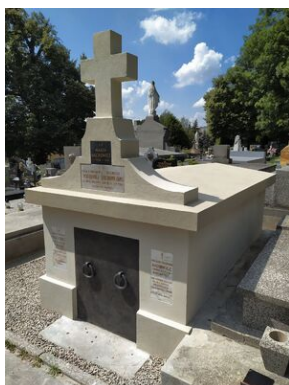
Grób po remoncie.