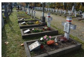
„Dzień Zadumy” w kieleckim liceum.