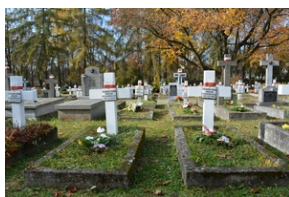
„Dzień Zadumy” w kieleckim liceum.