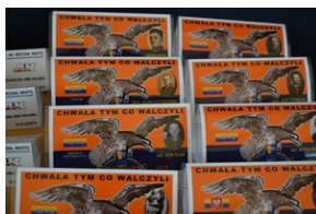
„Dzień Zadumy” w kieleckim liceum.