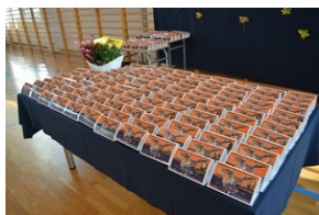
„Dzień Zadumy” w kieleckim liceum.

Po uroczystości młodzież szkolna udała się na kieleckie cmentarze w celu złożenia okolicznościowych wiązanek na pozostawionych bez opieki grobach weteranów walk i osób zasłużonych.