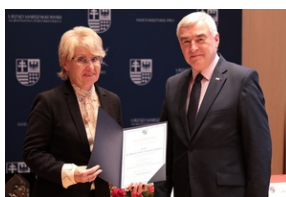
Powołano Komitet Honorowy obchodów 80. rocznicy Pacyfikacji Wsi Michniów.