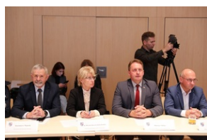
Powołano Komitet Honorowy obchodów 80. rocznicy Pacyfikacji Wsi Michniów.

13 października 2017 r. prezydent podpisał ustawę, która ustanowiła nowe święto państwowe - Dzień Walki i Męczeństwa Wsi Polskiej. Jest ono obchodzone 12 lipca, m.in. dla upamiętnienia ofiar z Michniowa.