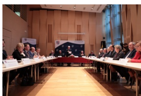
Powołano Komitet Honorowy obchodów 80. rocznicy Pacyfikacji Wsi Michniów.