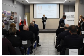
Kielce. Wręczenie Krzyży Wolności i Solidarności.