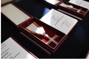
Kielce. Wręczenie Krzyży Wolności i Solidarności.