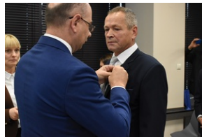
Kielce. Wręczenie Krzyży Wolności i Solidarności.