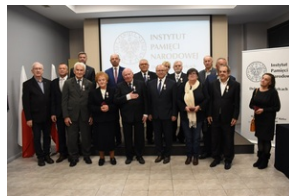
Kielce. Wręczenie Krzyży Wolności i Solidarności.