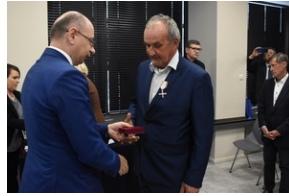
Kielce. Wręczenie Krzyży Wolności i Solidarności.