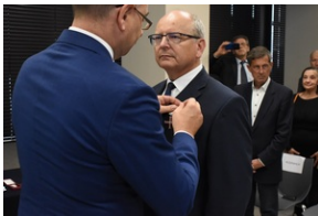
Kielce. Wręczenie Krzyży Wolności i Solidarności.