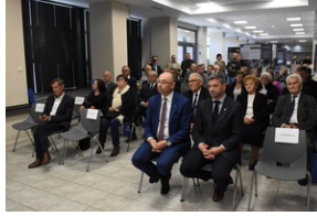
Kielce. Wręczenie Krzyży Wolności i Solidarności.