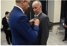
Kielce. Wręczenie Krzyży Wolności i Solidarności.