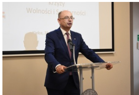
Kielce. Wręczenie Krzyży Wolności i Solidarności.