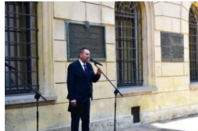
Uroczystość upamiętniająca działaczy WiN i PSL skazanych w procesie krakowskim.