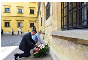
Uroczystość upamiętniająca działaczy WiN i PSL skazanych w procesie krakowskim.