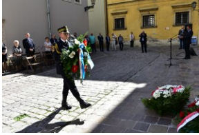
Uroczystość upamiętniająca działaczy WiN i PSL skazanych w procesie krakowskim.