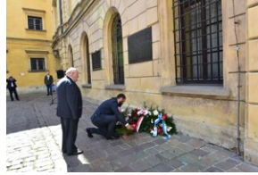
Uroczystość upamiętniająca działaczy WiN i PSL skazanych w procesie krakowskim.