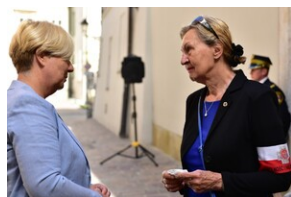
Uroczystość upamiętniająca działaczy WiN i PSL skazanych w procesie krakowskim.