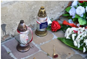
Uroczystość upamiętniająca działaczy WiN i PSL skazanych w procesie krakowskim.