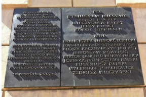
Uroczystość upamiętniająca działaczy WiN i PSL skazanych w procesie krakowskim.