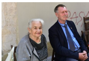
Uroczystość upamiętniająca działaczy WiN i PSL skazanych w procesie krakowskim.