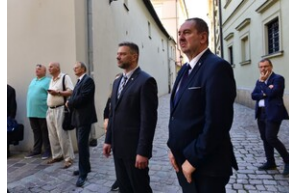
Uroczystość upamiętniająca działaczy WiN i PSL skazanych w procesie krakowskim.