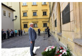
Uroczystość upamiętniająca działaczy WiN i PSL skazanych w procesie krakowskim.