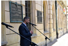
Uroczystość upamiętniająca działaczy WiN i PSL skazanych w procesie krakowskim.