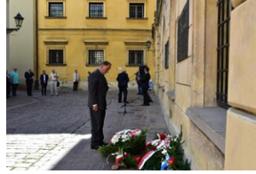
Uroczystość upamiętniająca działaczy WiN i PSL skazanych w procesie krakowskim.