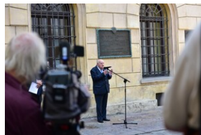
Uroczystość upamiętniająca działaczy WiN i PSL skazanych w procesie krakowskim.