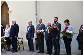
Uroczystość upamiętniająca działaczy WiN i PSL skazanych w procesie krakowskim.