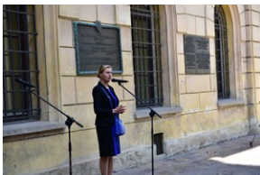
Uroczystość upamiętniająca działaczy WiN i PSL skazanych w procesie krakowskim.