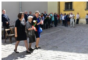
Uroczystość upamiętniająca działaczy WiN i PSL skazanych w procesie krakowskim.