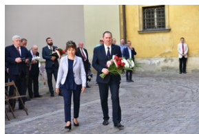
Uroczystość upamiętniająca działaczy WiN i PSL skazanych w procesie krakowskim.