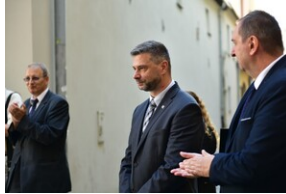
Uroczystość upamiętniająca działaczy WiN i PSL skazanych w procesie krakowskim.