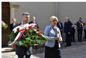
Uroczystość upamiętniająca działaczy WiN i PSL skazanych w procesie krakowskim.