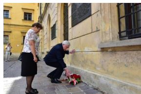
Uroczystość upamiętniająca działaczy WiN i PSL skazanych w procesie krakowskim.