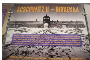
Wystawa o niemieckich obozach zagłady na „Przystanku Historia” w Kielcach.