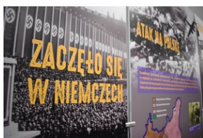
Wystawa o niemieckich obozach zagłady na „Przystanku Historia” w Kielcach.