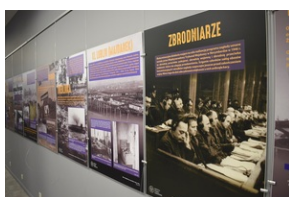
Wystawa o niemieckich obozach zagłady na „Przystanku Historia” w Kielcach.