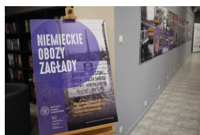
Wystawa o niemieckich obozach zagłady na „Przystanku Historia” w Kielcach.