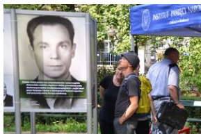
Wystawa o prof. Wacławie Felczaku na Plantach.