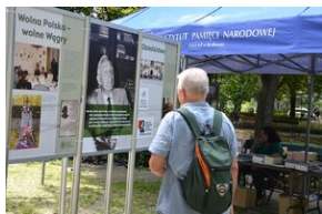
Wystawa o prof. Wacławie Felczaku na Plantach.