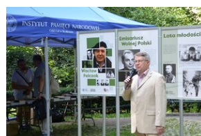
Wystawa o prof. Wacławie Felczaku na Plantach.