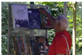
Wystawa o prof. Wacławie Felczaku na Plantach.