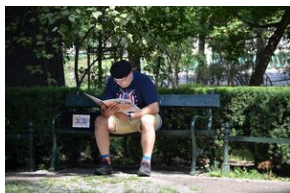
Wystawa o prof. Wacławie Felczaku na Plantach.