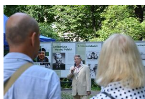
Wystawa o prof. Wacławie Felczaku na Plantach.