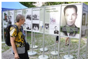
Wystawa o prof. Wacławie Felczaku na Plantach.