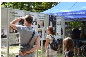
Wystawa o prof. Wacławie Felczaku na Plantach.