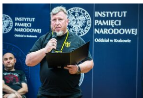
Pokaz filmu o Jacku Smagowiczu.