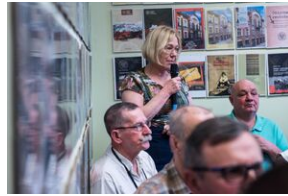
Pokaz filmu o Jacku Smagowiczu.