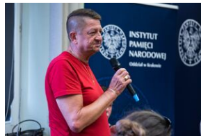
Pokaz filmu o Jacku Smagowiczu.