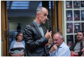
Pokaz filmu o Jacku Smagowiczu.