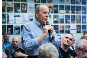
Pokaz filmu o Jacku Smagowiczu.