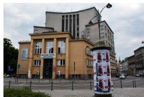
Pokaz filmu o Jacku Smagowiczu.