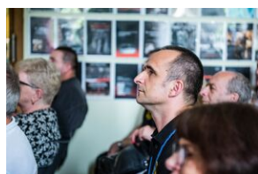
Pokaz filmu o Jacku Smagowiczu.