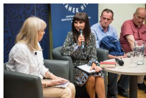
Pokaz filmu o Jacku Smagowiczu.