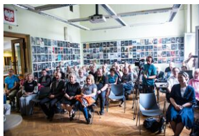
Pokaz filmu o Jacku Smagowiczu.