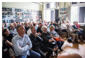
Pokaz filmu o Jacku Smagowiczu.