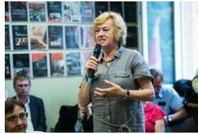
Pokaz filmu o Jacku Smagowiczu.