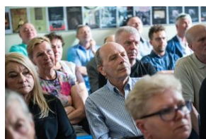
Pokaz filmu o Jacku Smagowiczu.