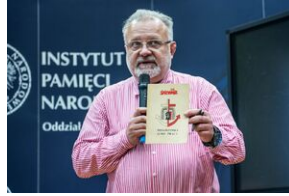
Pokaz filmu o Jacku Smagowiczu.