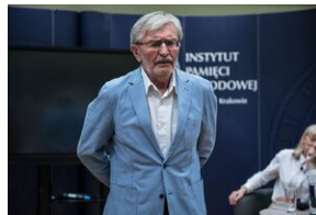
Pokaz filmu o Jacku Smagowiczu.