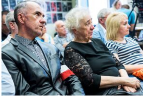
Pokaz filmu o Jacku Smagowiczu.