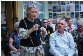
Pokaz filmu o Jacku Smagowiczu.