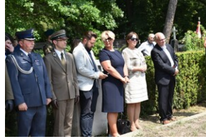
Odsłonięcie pomnika gen. Bolesława Wieniawy-Długoszowskiego.