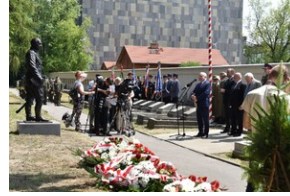
Odsłonięcie pomnika gen. Bolesława Wieniawy-Długoszowskiego.