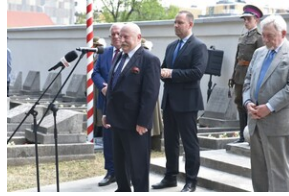
Odsłonięcie pomnika gen. Bolesława Wieniawy-Długoszowskiego.