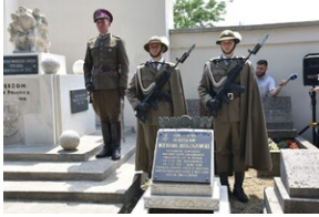
Odsłonięcie pomnika gen. Bolesława Wieniawy-Długoszowskiego.