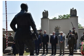
Odsłonięcie pomnika gen. Bolesława Wieniawy-Długoszowskiego.