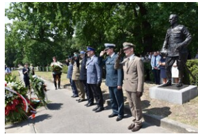
Odsłonięcie pomnika gen. Bolesława Wieniawy-Długoszowskiego.