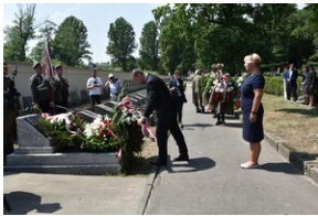
Odsłonięcie pomnika gen. Bolesława Wieniawy-Długoszowskiego.