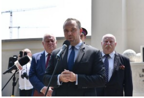
Odsłonięcie pomnika gen. Bolesława Wieniawy-Długoszowskiego.