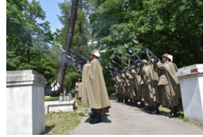
Odsłonięcie pomnika gen. Bolesława Wieniawy-Długoszowskiego.