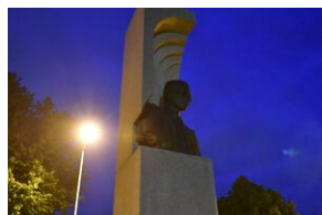
Pomnik na terenie Małopolskiej Uczelni Państwowej w Oświęcimiu.