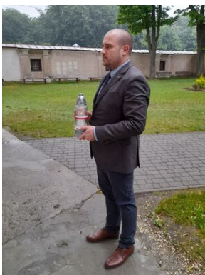
Tablica pamiątkowa w klasztorze bernardynów w Alwerni