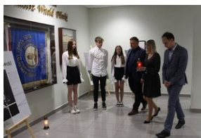
Rtm. Pilecki jest patronem Wielozawodowego Zespołu Szkół w Zatorze