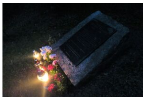
Dworek w Koryznówce (Nowy Wiśnicz)