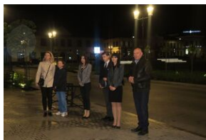
Rynek w Bochni