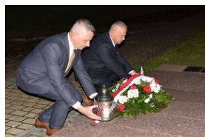
Pomnik na terenie Małopolskiej Uczelni Państwowej w Oświęcimiu.

transport więźniów do KL Auschwitz. Do obozu zagłady trafiło wówczas 728 Polaków, m.in. członkowie niepodległościowej konspiracji oraz aresztowani w obławach i łapankach.