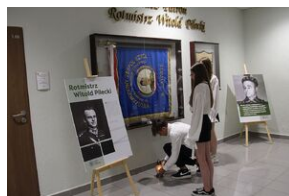
Rtm. Pilecki jest patronem Wielozawodowego Zespołu Szkół w Zatorze