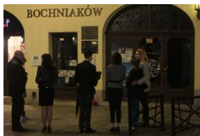
Rynek w Bochni