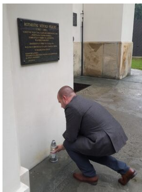
Tablica pamiątkowa w klasztorze bernardynów w Alwerni