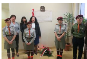
Szkoła w Jodłówce