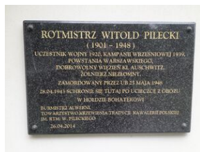
Tablica pamiątkowa w klasztorze bernardynów w Alwerni