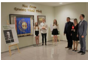
Rtm. Pilecki jest patronem Wielozawodowego Zespołu Szkół w Zatorze