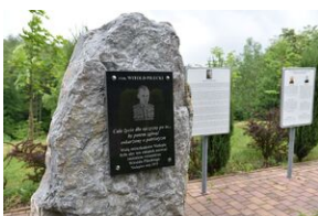
Park im. rtm. Witolda Pileckiego w Nielepicach.