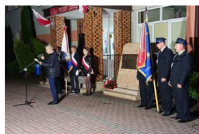
Fot. SP w Kierzu Niedźwiedzim