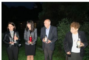
Dworek w Koryznówce (Nowy Wiśnicz)