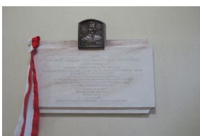
Szkoła w Jodłówce