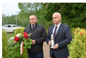
Park im. rtm. Witolda Pileckiego w Nielepicach.