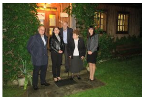
Dworek w Koryznówce (Nowy Wiśnicz)