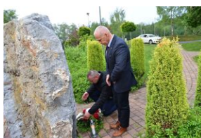
Park im. rtm. Witolda Pileckiego w Nielepicach.