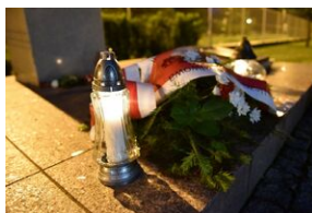
Pomnik na terenie Małopolskiej Uczelni Państwowej w Oświęcimiu.

W Świętokrzyskiem patriotyczne uroczystości odbyły się w Krasocinie (pow. Włoszczowa) i Kierzu Niedźwiedzim (pow. Skarżysko-Kamienna). Społeczność Zespołu Placówek Oświatowych im. rtm. Witolda Pileckiego w Krasocinie upamiętniła rocznicę śmierci rotmistrza zapalając znicze pamięci i składając kwiaty przy tablicy w budynku szkoły. Dzieci z najmłodszych klas utworzyły znak Polski Walczącej w hołdzie patronowi szkoły. Krasocińska placówka zdobyła w tym roku po raz drugi z rzędu Złotą Odznakę Rotmistrza w ogólnopolskim turnieju organizowanym przez Muzeum Dom Rodziny Pileckich.