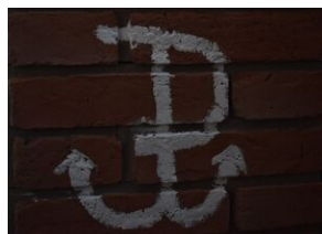
Kotwica Polski Walczącej. Wystawa na kieleckim Przystanku Historia.