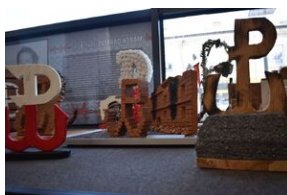
Kotwica Polski Walczącej. Wystawa na kieleckim Przystanku