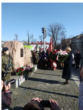
Uroczystości w Tarnowie