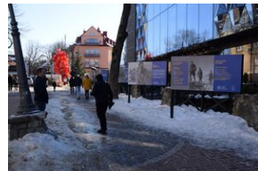
Wystawa o AK w Zakopanem