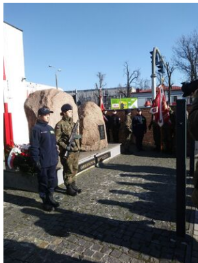
Uroczystości w Tarnowie