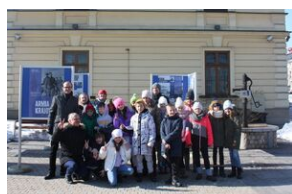
Wystawa o AK w Nowym Targu.