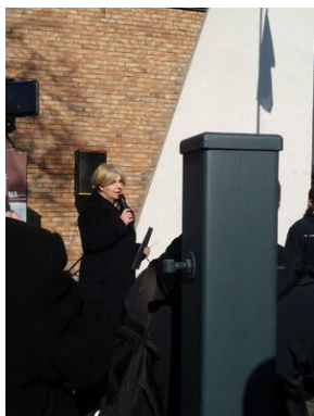
Uroczystości w Tarnowie