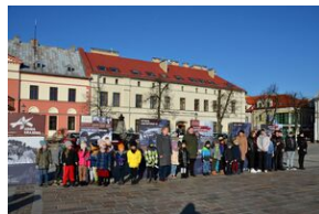
Prezentacja wystawy o AK na Rynku w Olkuszu