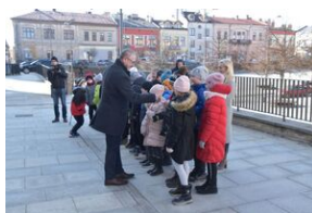
Otwarcie wystawy o AK w Gorlicach.