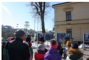
Wystawa o AK w Nowym Targu.