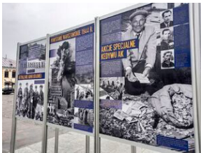
Wystawa o AK w Nowym Sączu