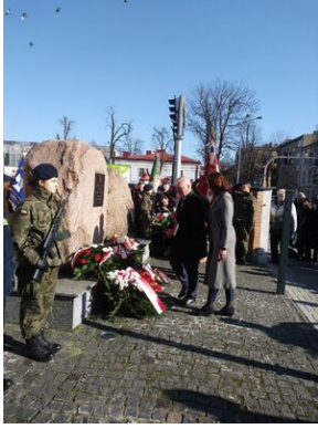
Uroczystości w Tarnobrzegu