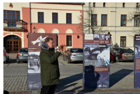
Prezentacja wystawy o AK na Rynku w Olkuszu

W uroczystości otwarcia wystawy, która pozostanie na olkuskim Rynku do połowy marca, wzięła udział młodzież z olkuskiej Szkoły Podstawowej nr 1 oraz Zespołu Szkół nr 3.