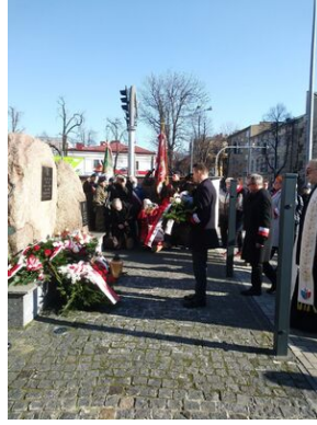
Uroczystości w Tarnobrzegu