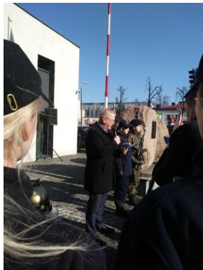
Uroczystości w Tarnowie