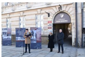
Otwarcie wystawy o AK w Gorlicach.

Dr Korcuć krótko przedstawił uczniom najmłodszych klas rolę, jaką w czasie II wojny światowej odegrała AK oraz przekazał pakiety edukacyjne. Wystawa będzie prezentowana na gorlickim Rynku do końca lutego.