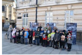
Otwarcie wystawy o AK w Gorzów Śląski.