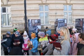
Otwarcie wystawy o AK w Gorzów Śląski.