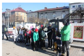
Wystawa o AK w Nowym Targu.