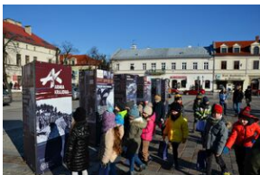
Prezentacja wystawy o AK na Rynku w Olkuszu