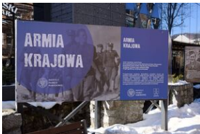
Wystawa o AK w Zakopanem