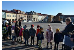
Prezentacja wystawy o AK na Rynku w Olkuszu