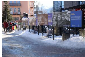
Wystawa o AK w Zakopanem