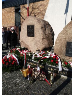
Uroczystości w Tarnobrzegu