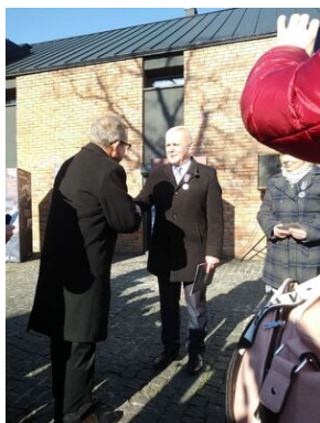
Uroczystości w Tarnowie