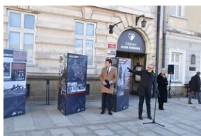
Otwarcie wystawy o AK w Gorlicach.