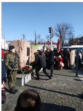
Uroczystości w Tarnowie