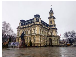
Wystawa o AK w Nowym Sączu