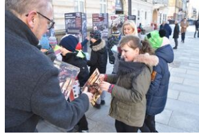
Otwarcie wystawy o AK w Gorzów Śląski.