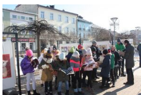
Wystawa o AK w Nowym Targu.