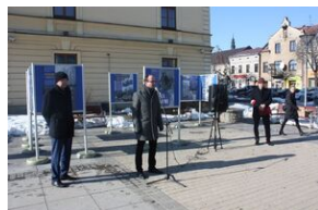
Wystawa o AK w Nowym Targu.