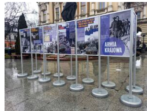
Wystawa o AK w Nowym Sączu