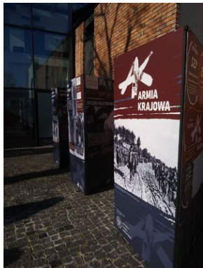
Uroczystości w Tarnowie