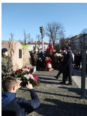
Uroczystości w Tarnowie