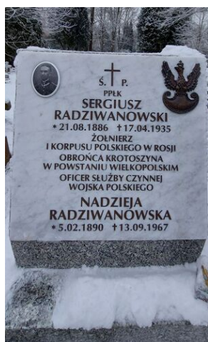
Znicze na grobie ppłk. Radziwanowskiego, powstańca wielkopolskiego.

W 1928 r. przeszedł na emeryturę i zamieszkał w Krakowie. W tym okresie pisał artykuły do „Dzwonu Niedzielnego”, „Głosu Narodu”, „Mysterium Christi” i „Sodalis Marianus”. Zmarł w 1935 r. Został pochowany na cmentarzu Rakowickim. Krakowski IPN sfinansował remont grobu bohatera.