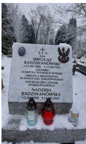
Znicze na grobie ppłk. Radziwanowskiego, powstańca wielkopolskiego.