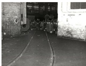
16 grudnia 1981. Pacyfikacja strajku w Hucie im. Lenina.