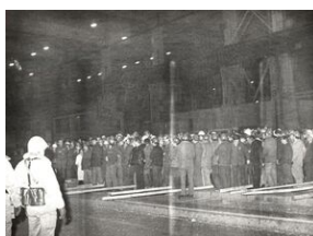
16 grudnia 1981. Pacyfikacja strajku w Hucie im. Lenina.