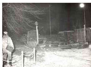
16 grudnia 1981. Pacyfikacja strajku w Hucie im. Lenina.

Apelujemy do uczestników wydarzeń sprzed 40 lat o przekazanie do archiwum IPN fotografii i relacji, które pomogą uzupełnić mapę oporu w Małopolsce.