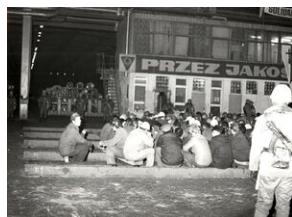
16 grudnia 1981. Pacyfikacja strajku w Hucie im. Lenina.