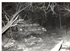
16 grudnia 1981. Pacyfikacja strajku w Hucie im. Lenina.