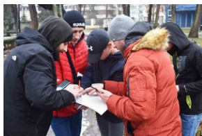
Gra miejska „Spacerniak” w Kielcach.