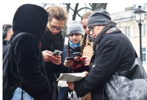
Gra miejska „Spacerniak” w Kielcach.