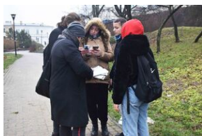
Gra miejska „Spacerniak” w Kielcach.