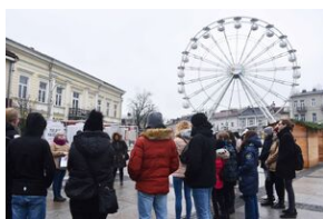
Gra miejska „Spacerniak” w Kielcach.

Uczestnicy gry przyznali, że głównym powodem wzięcia w niej udziału była chęć dobrej zabawy oraz poszerzania wiedzy. – Przygotowywaliśmy do tej gry od kilku tygodni i zapoznawaliśmy się z materiałami IPN-u. Uczniowie są chętni do zgłębiania wiedzy, więc myślę, że sobie poradzimy – mówiła nauczycielka w Zespole Szkół Ekonomicznych im. Kopernika w Kielcach.