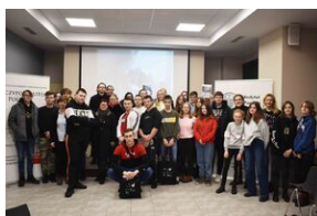
Gra miejska „Spacerniak” w Kielcach.