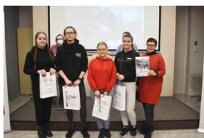
Gra miejska „Spacerniak” w Kielcach.