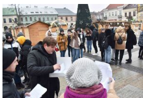
Gra miejska „Spacerniak” w Kielcach.