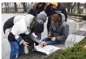
Gra miejska „Spacerniak” w Kielcach.