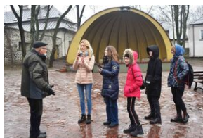
Gra miejska „Spacerniak” w Kielcach.