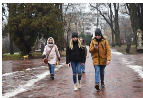
Gra miejska „Spacerniak” w Kielcach.