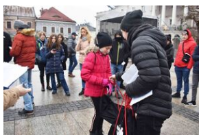
Gra miejska „Spacerniak” w Kielcach.