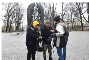
Gra miejska „Spacerniak” w Kielcach.