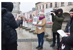
Gra miejska „Spacerniak” w Kielcach.