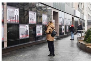
Gra miejska „Spacerniak” w Kielcach.