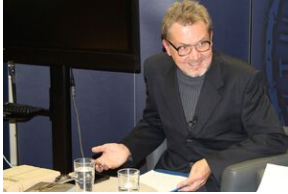
Fenomen Piłsudskiego. Dyskusja na Przystanku Historia.