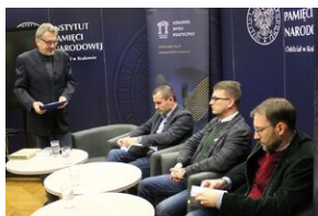
Fenomen Piłsudskiego. Dyskusja na Przystanku Historia.

Jak pisze autor: „...dotąd nikt źródłowo nie prześledził ewolucji Piłsudskiego w osobnym monograficznym ujęciu poprzez kontekst nie jego indywidualnych losów i doświadczeń [...], lecz biorąc [...] za punkt wyjścia jego stosunki z współpracownikami, a czasem podkomendnymi, w których bądź oni sami się przeistoczyli, bądź Piłsudski ich do tego sprowadził”. Równocześnie to stroniąca od ahistoryzmu, empatyczna opowieść o pokoleniu, o środowisku, które „nie tylko walczyło o niepodległość, ale ją uzyskało”.