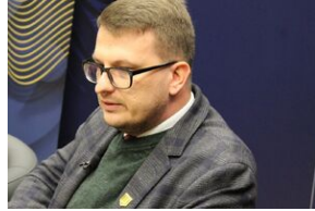
Fenomen Piłsudskiego. Dyskusja na Przystanku Historia.