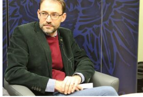
Fenomen Piłsudskiego. Dyskusja na Przystanku Historia.