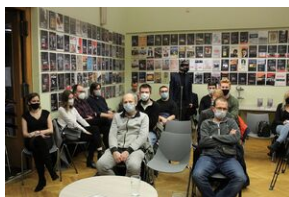
Fenomen Piłsudskiego. Dyskusja na Przystanku Historia.