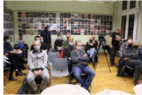
Fenomen Piłsudskiego. Dyskusja na Przystanku Historia.