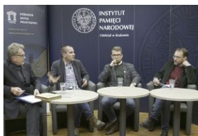
Fenomen Piłsudskiego. Dyskusja na Przystanku Historia.