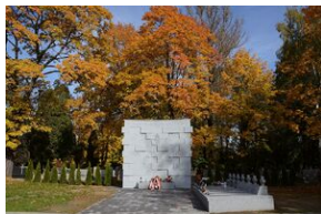
Grób ks. Władysława Gurgacza na cmentarzu Rakowickim.