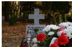
Grób ks. Władysława Gurgacza na cmentarzu Rakowickim.