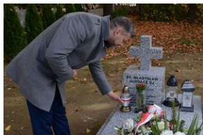
Grób ks. Władysława Gurgacza na cmentarzu Rakowickim.