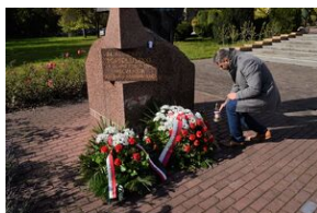
Pomniki bł. ks. Jerzego Popiełuszki w Nowej Hucie.