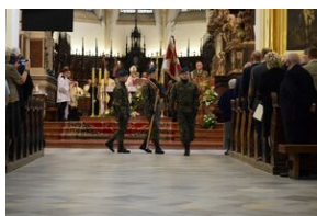
Tarnowskie obchody w 82. rocznicę powstania Polskiego Państwa Podziemnego