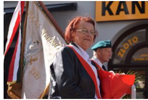
Tarnowskie obchody w 82. rocznicę powstania Polskiego Państwa Podziemnego