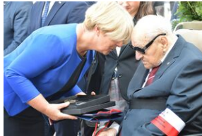
Tarnowskie obchody w 82. rocznicę powstania Polskiego Państwa Podziemnego