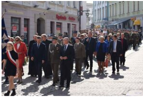
Tarnowskie obchody w 82. rocznicę powstania Polskiego Państwa Podziemnego