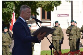
Tarnowskie obchody w 82. rocznicę powstania Polskiego Państwa Podziemnego