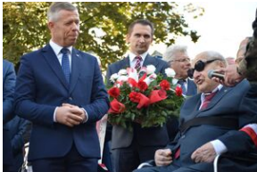
Tarnowskie obchody w 82. rocznicę powstania Polskiego Państwa Podziemnego