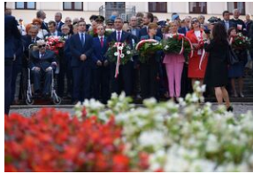
Tarnowskie obchody w 82. rocznicę powstania Polskiego Państwa Podziemnego