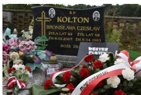
Grób Czesława Kołtona w Sarnówku Dużym.