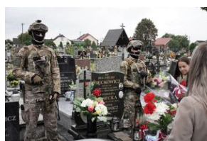
Grób Bolesława Więckowicza w Kozłowie.