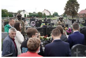
Grób Jana Zdeba w Koziołowie.