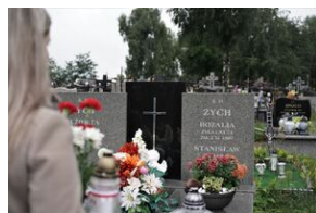
Grób Stanisława Zycha w Piekoszowie.