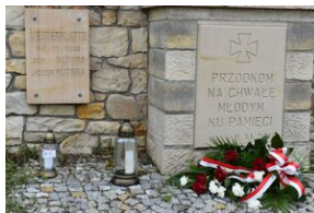
Grób Józefa Kutery w Krynkach.