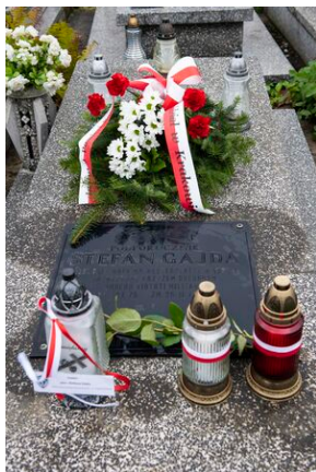
Grób Stefana Gajdy w Kazimierzy Wielkiej.