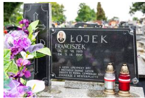
Grób Franciszka Łojka w Zborówku.