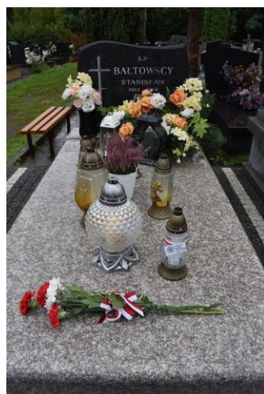
Grób Stanisława Bałtowskiego w Starachowicach.