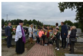
Grób Edwarda Rokickiego w Pierzchnicy.