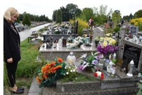
Grób Piotra Borowca w Starachowicach.