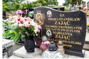
Grób Stanisława Zajęca w Zborówku.