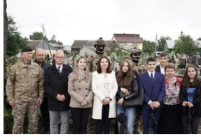
Grób Jana Zdeba w Koziołowie.