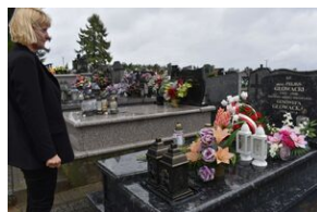
Grób Feliksa Głowackiego w Cnybicach.