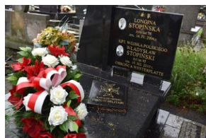
Grób Władysława Stopińskiego w Skarżysku-Kościelelnym.