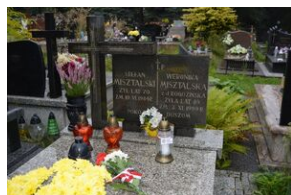
Grób Stefana Misztańskiego w Cedzynie.