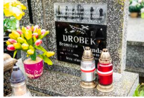
Grób Bronisława Drobka w Brzostkowie.