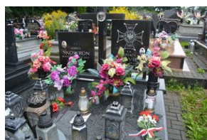
Grób Ignacego Skowrona w Brzezinach.