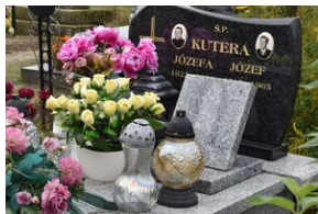
Grób Józefa Kutery w Krynkach.