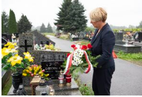
Grób Bronisława Drobka w Brzostkowie.