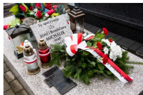
Grób Józefa Michalika w Kazimierzy Małej.