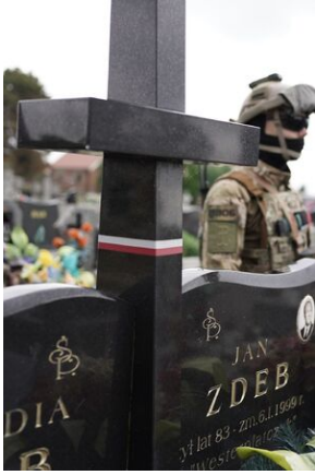
Grób Jana Zdeba w Koziołowie.