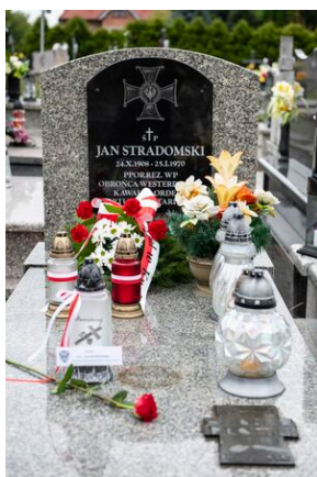
Grób Jana Stradomskiego w Kazimierzy Wielkiej.