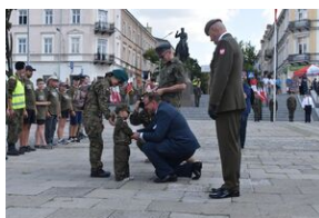
Zakończenie marszu szlakiem kadrówki w Kielcach.