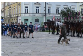
Zakończenie marszu szlakiem kadrówki w Kielcach.