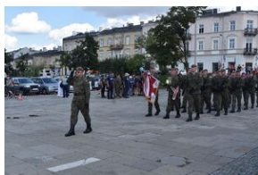
Zakończenie marszu szlakiem kadrówki w Kielcach.