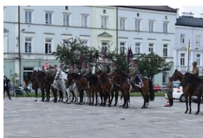
Zakończenie marszu szlakiem kadrówki w Kielcach.