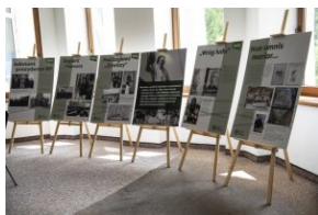
Wystawa „Mariusz Zaruski” w Starostwie Tatrzańskim.