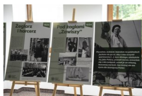
Wystawa „Mariusz Zaruski” w Starostwie Tatrzańskim.