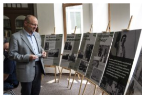
Wystawa „Mariusz Zaruski” w Starostwie Tatrzańskim.