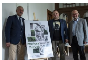
Wystawa „Mariusz Zaruski” w Starostwie Tatrzańskim.