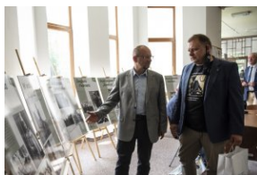
Wystawa „Mariusz Zaruski” w Starostwie Tatrzańskim.