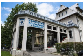
Wystawa „Mariusz Zaruski” w Starostwie Tatrzańskim.