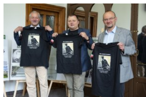
Wystawa „Mariusz Zaruski” w Starostwie Tatrzańskim.