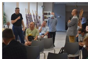
Kielce, 10.07.2021. Konferencja naukowa o martyrologii wsi polskiej.