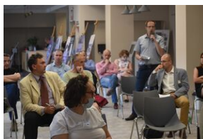
Kielce, 10.07.2021. Konferencja naukowa o martyrologii wsi polskiej.

Spotkanie poświęcone było problematyce ofiar najokrutniejszych represji i ich losów, rzeczywistości po pacyfikacjach, procesie odbudowy spalonych wsi. W centrum uwagi znalazł się człowiek – świadek niemieckiego i sowieckiego okrucieństwa. Symbolicznym miejscem upamiętnienia martyrologii wszystkich miejscowości spacyfikowanych podczas II wojny światowej stał się Michniów w woj. świętokrzyskim.