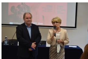
Kielce, 10.07.2021. Konferencja naukowa o martyrologii wsi polskiej.

10 lipca 2021 r. w Centrum Edukacyjnym „Przystanek Historia” IPN w Kielcach odbyła się konferencja naukowa zorganizowana w ramach obchodów Dnia Walki i Męczeństwa Wsi Polskiej.