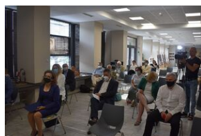
Kielce, 10.07.2021. Konferencja naukowa o martyrologii wsi polskiej.