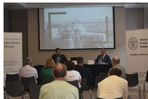
Kielce, 10.07.2021. Konferencja naukowa o martyrologii wsi polskiej.