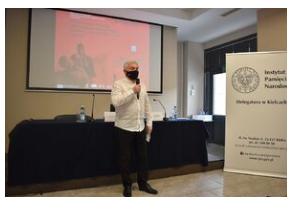
Kielce, 10.07.2021. Konferencja naukowa o martyrologii wsi polskiej.