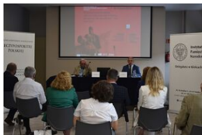
Kielce, 10.07.2021. Konferencja naukowa o martyrologii wsi polskiej.